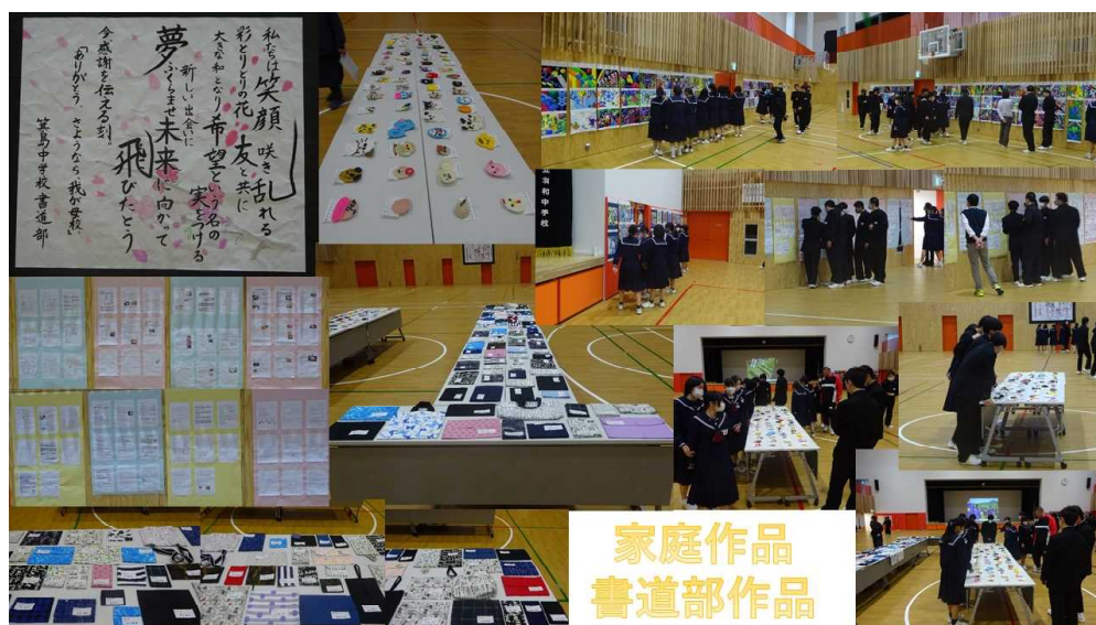
家庭作品 書道部作品

箕島中学校の校歌の一番に「文化」という言葉出てきます。箕島中学校の生徒と教職員が一緒になって、自分たちの手で築き上げてきたものです。